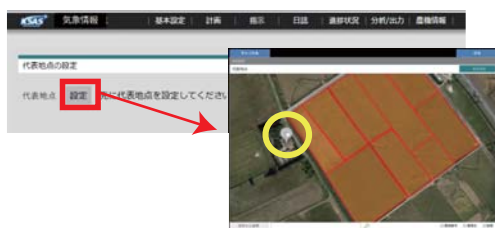
地図上にポイントを設定